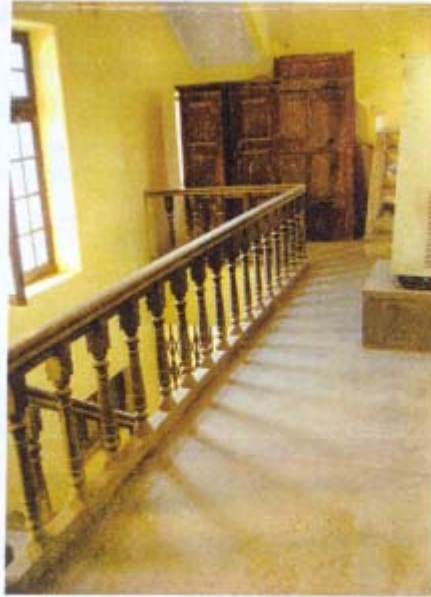
कैरीन के सन्नि, मंहर