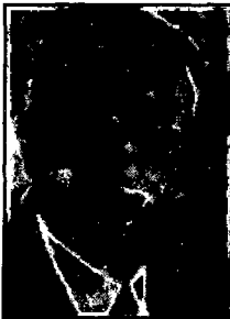
Dr. SHANTI SWARUP BHATNAGAR Eminent Scientist who composed the BHU Kulgeet

So sweet, serene; infinitely beautiful This is the presiding centre of all learning.