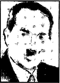
Dr. SHANTI SWARUP BHATNAGAR Eminent Scientist who composed the BHU Kulgeet

So sweet, serene, infinitely beautiful This is the presiding centre of all learning.