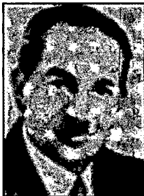
Dr. SHANTI SWARUP BHATNAGAR Eminent Scientist who composed the BHU Kulgeet

So sweet, serene, infinitely beautiful This is the presiding centre of all learning.