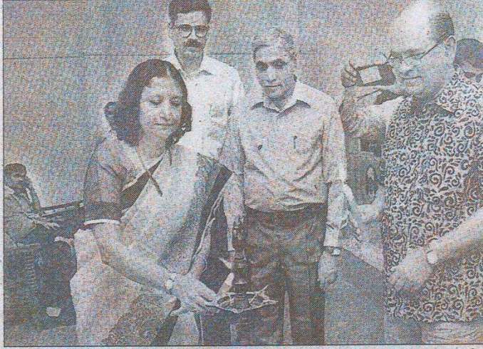
बीएचयू के प्रबंध अध्ययन संस्थान में मंगलवार को दीप जलाकर कार्यक्रम का उद्घाटन करती विश्व बैंक की एमडी अंशुलाकांत।

विश्व बैंक की एमडी अंशुलाकांत ने किया बीएचयू प्रबंध संस्थान में छह दिवसीय इंडक्शन प्रोग्राम का शुभारंभ