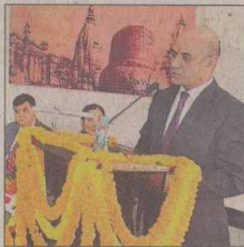
संगोष्ठी को संबोधित करते नितिन चार्च।

जागरण संवाददाता, वाराणसी : एचडीएफसी बैंक के कंट्री हेड नितिन चार्च ने शनिवार को बीएचयू के प्रबंध शास्त्र संस्थान में कहा कि आगे आने वाला समय रोबोट बैंकिंग का होगा। इससे बैंक की सुविधाएं बढ़ेंगी, जिसका लाभ उपभोक्ताओं को होगा। हालांकि उन्होंने यह भी स्पष्ट किया कि इससे कर्मचारियों की नौकरी पर कोई असर नहीं पड़ेगा बल्कि उनको कार्य में सहायता मिलेगी। चार्च 'अगली पीढ़ी के संगठनों प्रबंधन' विषय राष्ट्रीय संगोष्ठी में बतौर मुख्य अतिथि बोल रहे थे। उन्होंने देश में चल रही