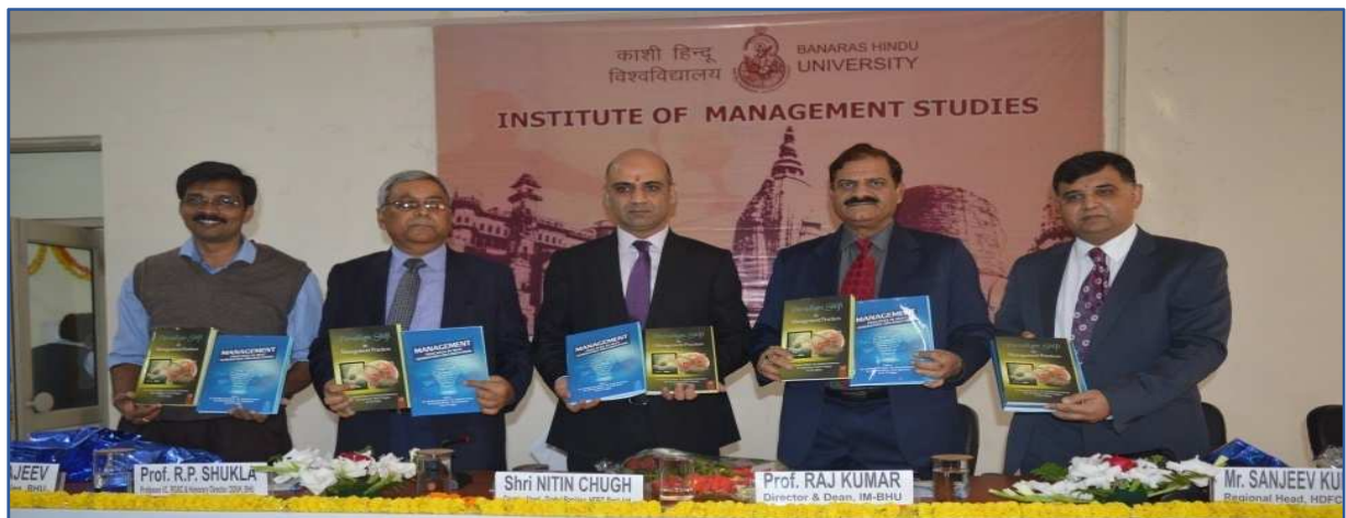
Releasing of books on Management Practices in Next Generation Organizations and Paradigm Shift in Management Practices .