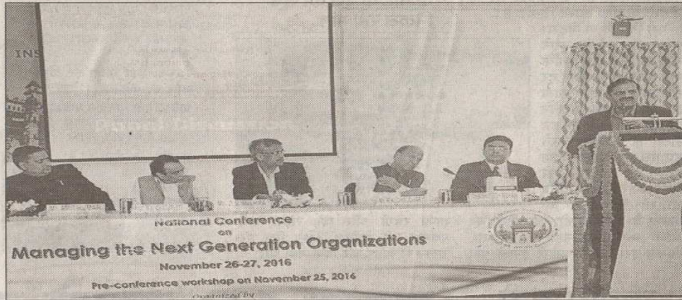
बीएचयू के प्रबंध शास्त्र संस्थान में आयोजित पैनल डिस्कशन में बोलते वक्ता

वाराणसी। भारतीय उद्योग क्षेत्र में बीते 30 साल के भीतर भारी बदलाव आ चुका है। अब राह आसान हो गयी है। इंडस्ट्री स्थापित करने की मुश्किलें बहुत कम हो चुकी हैं। वर्तमान के डिजिटल इंडिया दौर में सिर्फ उद्योग ही नहीं सभी क्षेत्र में बेहतर ढंग से आगे बढ़ने का रास्ता सरल है। अब पूरी दुनिया एक परिवार में परिवर्तित होने के कारण दूरियों की समस्या भी नहीं रही।