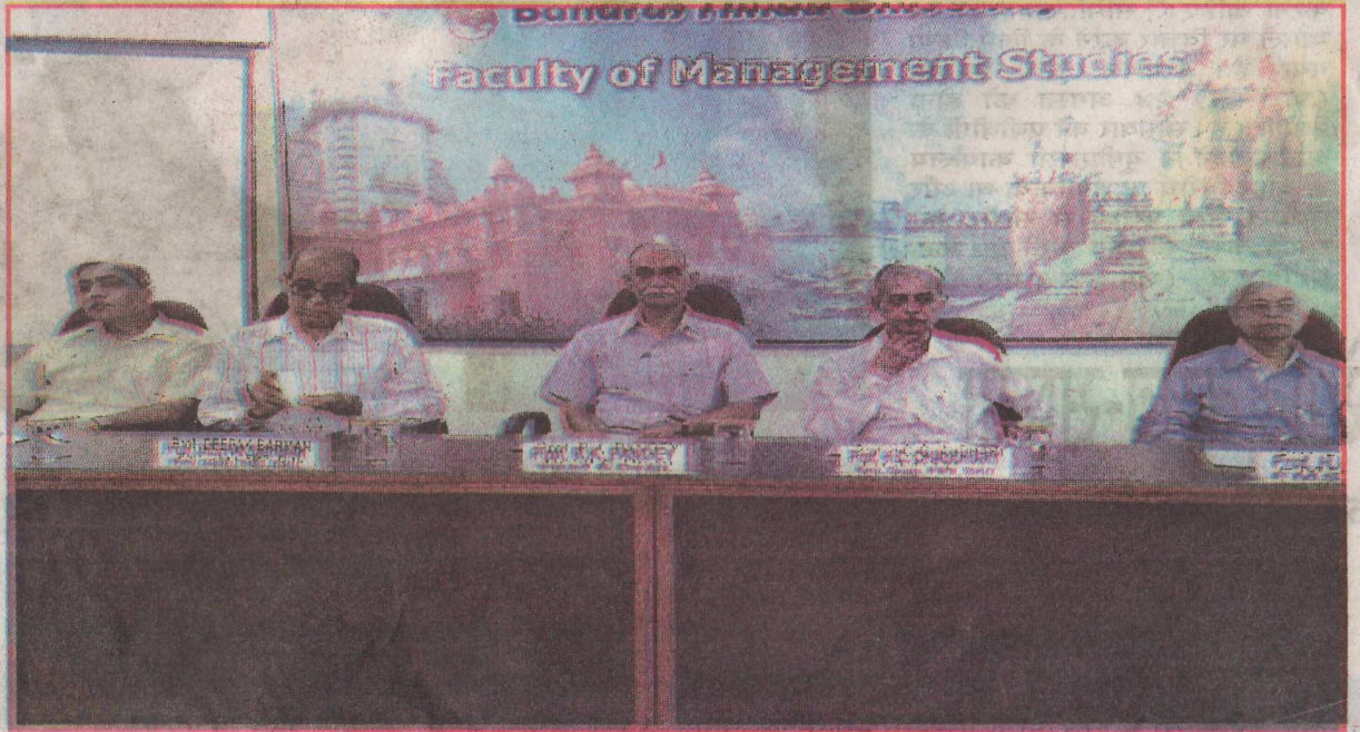
बीएचयू के प्रबंध शास्त्र संकायमें आयोजित कार्यक्रममें मंचासीन अतिथिगण ।