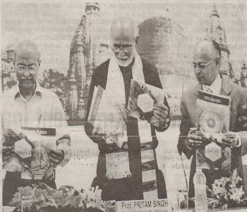
An interactive workshop being held at FMS BHU in Varanasi on Monday