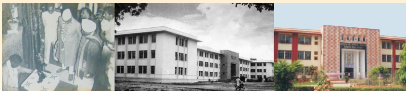
चिकित्सा विज्ञान संस्थान का शिलान्यास महाराष्ट्र के तत्कालीन मुख्यमंत्री द्वारा (1961)