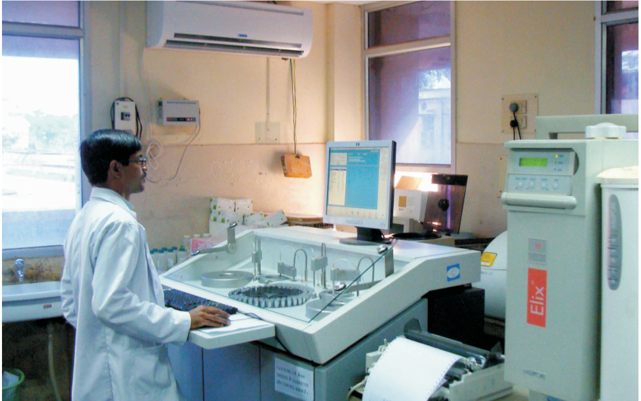
सर सुन्दर लाल अस्पताल के सी.सी.आई. लैब में आटो एनेलाइजर सुविधा