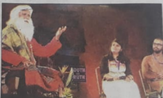
सदगुरु ने छात्रों को सुझाया जिंदगी संतारने का तरीका

वाराणसी (एसएनबी)। कृषि विज्ञान संस्थान (बीएचयू) के शताब्दी प्रेक्षागृह का नजारा सोमवार को गजब रहा। सदगुरु जग्गी वासुदेव को सुनने, उनसे अपने सवालों के जवाब तलाशने और उन जवाबों से अपनी जिंदगी तराशने को बेसुर छात्रों का हनुम इस कदर उमड़ कि जितने प्रेक्षागृह के अंदर उतने ही बाहर। उनको सुनने के लिए छात्रों ही नहीं बल्कि अन्य लोगों को भी भारी भीड़ उमड़ रही। जग्गी वासुदेव ने भी छात्रों को निराश नहीं किया और अपने ज्ञान को शब्दों से धार देते हुए छात्रों के अंकवार को सजाया। खचाखच भरे हाल में संवाद की कड़ी में उन्होंने ज्ञान के लिए ध्यान की आवश्यकता पर बल दिया। साथ ही युवाओं को ऊर्जा को सही दिशा देने की अपेक्षा की। उन्होंने सभी के सवालों का जवाब दिया और वापसी पर छात्रों के अनुरोध पर नृत्य भी करके दिखाया।