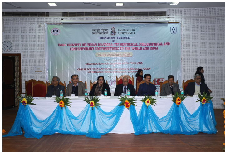
“Indic Identity of Indian Diaspora: Its Historical, Philosophical and Contemporary Contributions to the World and India” 24-25 January 2019 organized by Centre for Study of Social Exclusion and Inclusive Policy, Faculty of Social Sciences, BHU