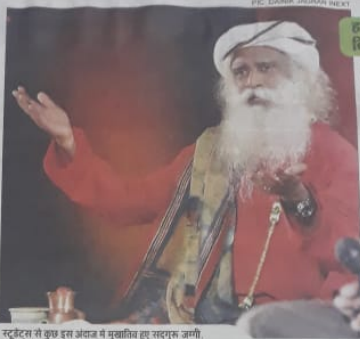
स्टूडेंट्स से कुछ इस अंजन में मुखाधिक हुए संतुलन जगगी.

varanasi@next.co.in VARANASI (24 Sept): आज का युवा वर्ग में अंधाधुंध समझौता और संवेदनहीनता है, उनमें असौखिन ऊर्जा है, कुछ कर पुजने का जकात है और संतुलन भी, पाए इन सबके बीच कहीं कुछ न कुछ ऐसा भी है जिसके चलते देश को युवा शक्ति सृष्ट और समाज के निर्माण में अपनी जान प्रणित धमोदारी सुनिश्चित नहीं कर पा रही है, जो ठीक नहीं है, पर सबका डर बेहतर हो सकता है अगर उनकी समस्याओं को समझे और समाधान भी बता सके, बीएचयू के स्टूडेंट्स की यह भीका संस्था का भीला, उनके पास मन की बात बनने के लिए, समने से ईशा, फाउंडेशन के संस्थापक संतुलन जगगी वास्तुदेव, सामाजिक चिंतक एवं सवसेवा मीति, अध्यात्म केंद्र की ओर से कुर्मी विमान संस्थान, बीएचयू के शान्ति प्रेक्षागृह में आयोजित 'युव एंड टू' कार्यक्रम में बीएचयू स्टूडेंट्स संतुलन से रुबक हुए और अपने मन की बात की, संतुलन ने उनको हर बात को सुना और सलाह तरीके से जवाब देकर उनकी जिज्ञासा शांत की,