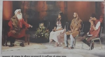
संतुलन से संबंद के दौरान कलाकारों ने म्यूजिक से बाधा समा.