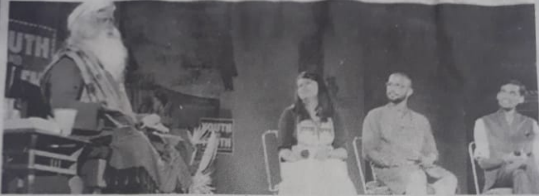
Sadhguru Jaggi Vasudev delivering a lecture at BHU in Varanasi on Monday